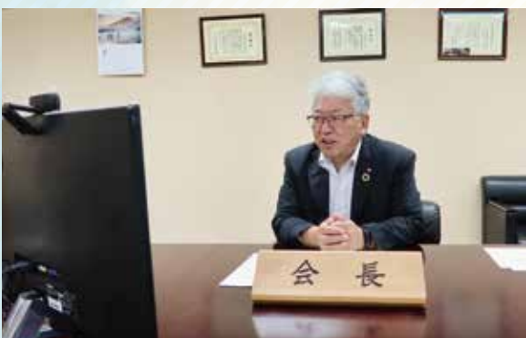
▲ 全国町村会長会議の様子（オンラインにて）

この度、県下の町村長の皆様からご推挙をいただき、第56代山梨県町村会長に就任いたしました。町村を取り巻く環境は、新型コロナウイルス感染症対策、財源確保をはじめ、極めて厳しく、課題が山積しております。山梨県町村会長として、県下町村の発展のため努力してまいります。