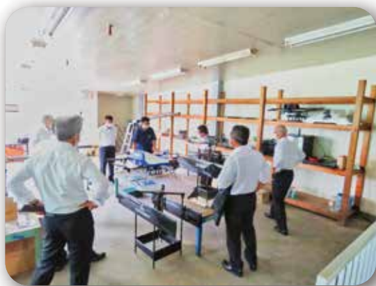
▲ 株式会社エアロネクスト