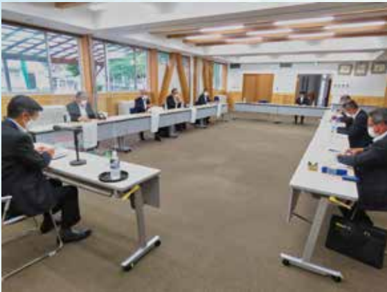
▲ 講師から厳しいコメントを頂くこともしばしば

今回の研修会を受けて、変化に柔軟に対応できる議会活動を展開しようと強く決意しました。