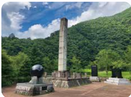
▲ 小金沢公園内にある記念碑

明治44年県下の御料地を県土復興に役立てるよう御下賜されました。これが今日の恩賜県有財産、いわゆる恩賜林と呼ばれています。この保護組合は大月市、上野原市、小菅村にまたがる小金沢土室山3,892haの山々を保護する目的により昭和30年に組織され、各市村より議会選挙により4名の議員が選出されています。