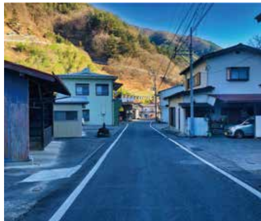
▲ 橋立地区冬季の様子

り要望に応じていくよう取り組んでいく。環境対策の観点からの施策は村では現状ではない。国、県の補助事業の中で取り組める事業があるか今後注視していく。