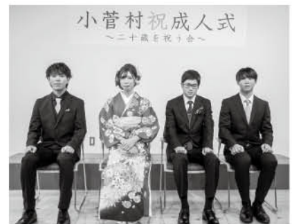
令和5年 「小菅村成人式~二十歳を祝う会~」より

日時 令和6年1月2日(火) 10:00~ 会場 中央公民館 4階講堂・3階カンファレンスホール 対象者 平成15年4月2日~平成16年4月1日生まれの方