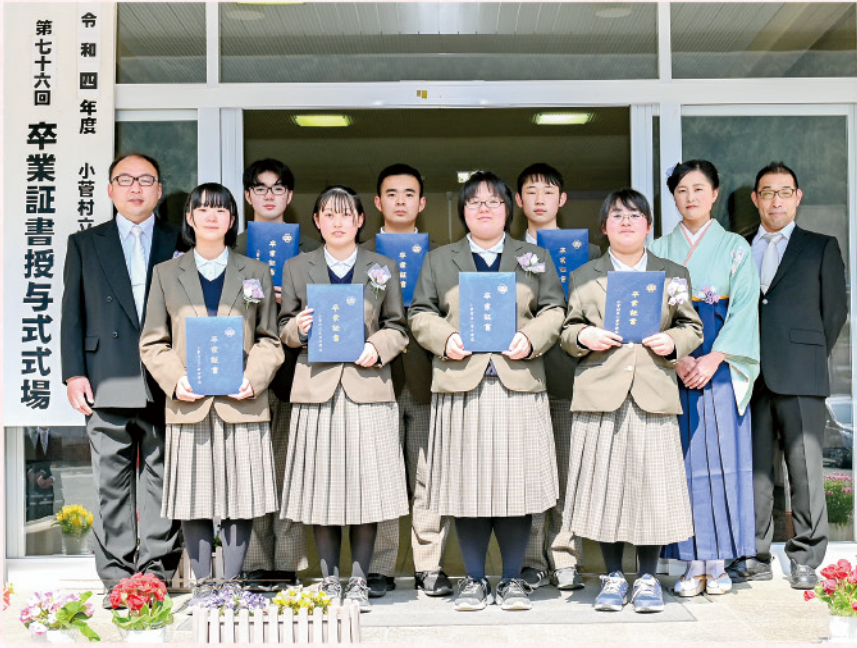
令和四年度 小菅村立 第七十六回 卒業証書授与式会場

3月9日(木)、小菅中学校第76回卒業証書授与式が挙行され、7名の生徒が、中学校の教育課程を修了し、卒業証書を受け取りました。しめやかで厳肅な証書授与、思い出の詰まった在校生からの贈る言葉、卒業生の別れの言葉、心のこもった全校合唱など感動的な式となりました。