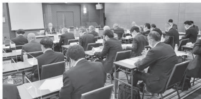
▲多くの加盟市町村が出席しました

本年度は、源流基本法制定に向けて、研修会、議員連盟との意見交換会の実施、第13回全国源流サミットIN三重県大台町の開催(オンライン)等、源流域の保全に向けた機運をさらに高める活動を進めていきます。