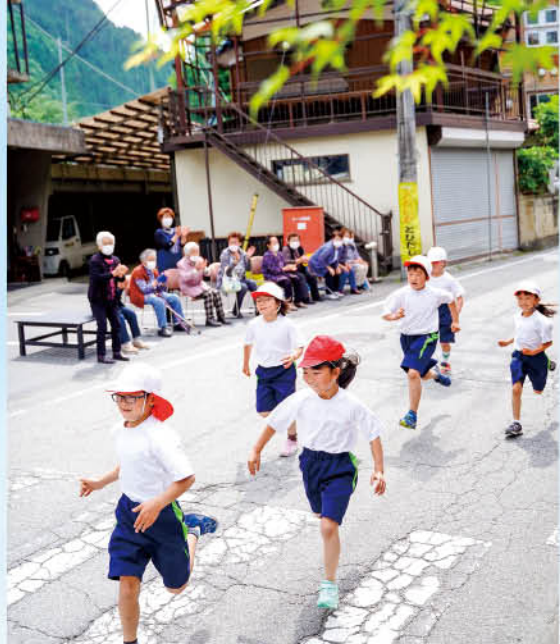
たくさんの応援が力になりました

5月26日(木)にマラソン大会が行われました。全校児童29人一人一人が目標をもち、あきらめない強い気持ちで完走することができました。結果には、それぞれ思うところもあったようですが、練習から当日までやりきったことに価値があると思います。これからも一つ一つの取り組みを大切に行っていきたいと思います。