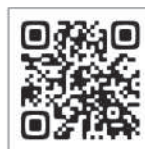
「こ、こすげえー」 アクセスQR

村民向けの公式LINEでは災害や通行止め等の緊急情報、暮らしや耳より情報を、月数回お届け。登録はQRコードを読み取り、「追加」ボタンをクリックするだけ。LINE上の検索では出てこないため、QRコードの読み取りをお願いします。