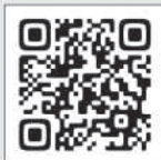
「源流大学」 記事アクセスQR

源流大学についての記事は、こちらのQRコードからご覧いただけます。携帯電話のカメラでこちらのQRコードを写すと、記事を読むためのボタンが出てきます。