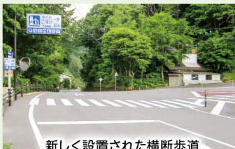
新しく設置された横断歩道 (道の駅こすげ入り口付近)

今回グリーンベルトが施された田元地内は一車線で幅員が狭く、歩道を確保することが困難となっている上に、自動車のすれ違い時に路側帯へはみ出す可能性がある危険な箇所です。このグリーンベルトは多くの児童が利用する道路であることを示すため、路側帯(またはその一部)を緑色に塗装して通学路の注意喚起を目的としています。