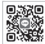
「こ、こすげえー」 公式LINE

源流大学についての記事は、こちらのQRコードからご覧いただけます。携帯電話のカメラでこちらのQRコードを写すと、記事を読むためのボタンが出てきます。