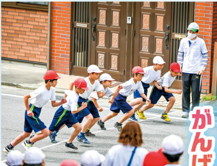
自分を信じて全力疾走