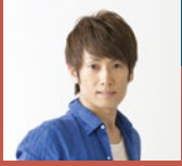
ビューティーこくぶ