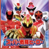
スーパー戦隊ヒーローショー