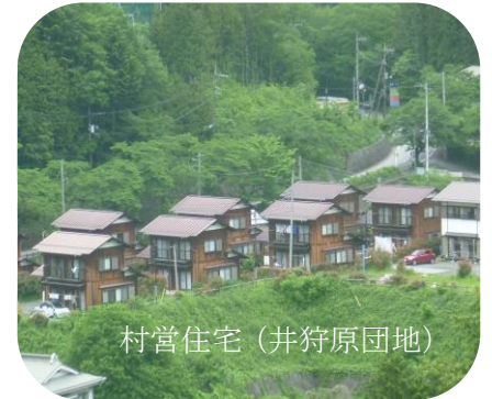
村営住宅(井狩原団地)

小菅村では、淀団地、井狩原団地、宮川団地に村営住宅が整備されています。また、村内では不動産業者がいませんので、空き家等の物件については、村が介入を行います。(村営住宅は入居に当たり、所得等を申告していただき家賃算定及び審査を行います。)