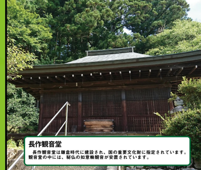
長作観音堂 長作観音堂は鎌倉時代に建設され、国の重要文化財に指定されています。 観音堂の中には、秘仏の如意輪観音が安置されています。