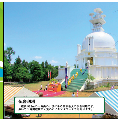
仏舎利塔 標高 982mの大寺山の山頂にある日本最大の仏舎利塔です。 歩いて1時間程度の人気のハイキングコースでもあります。