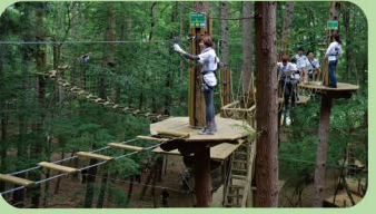
アドベンチャーコース