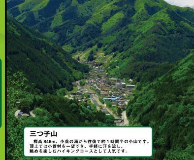
三つ子山 標高 846m。小菅の湯から徒歩約1時間半の小山です。 頂上では小菅村を一覧でき、手軽に汗を流し、 爽快感を楽しむハイキングコースとして人気です。