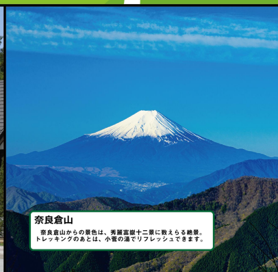
奈良倉山 奈良倉山からの景色は、秀麗富麗十二景に数えられる絶景。 トレッキングのあとは、小菅の湯でリフレッシュできます。