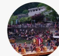
大菩薩御太鼓の熱演

多摩源流まつりは、「水と火と味の祭典」として毎年5月4日に開催されます。この祭りは村民が一丸となって作り上げる祭りであり、毎年1万人を超える人出で賑わいます。会場では小菅村だけでなく、多摩川流域の郷土芸能・郷土料理を堪能することができ、夜には、「お松焼き」が行われます。また、会場付近には全長約200メートルにわたる鯉のぼりが、上空を泳いで来場者を出迎えてくれます。