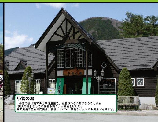
小菅の湯 小菅の湯は高アルカリ性温泉で、お肌がつるつるになることから 「美人の湯」としての評判も高く、大風呂をはじめ、 露天風呂や五右衛門風呂、岩湯、イベント風呂など九つのお風呂があります。