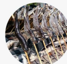
マスつかみどり、塩焼き