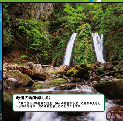
源流の滝を楽しむ 二筋の流れが特徴的な雄滝、36mの断崖から流れ落ちる白糸の滝など、 大小様々な滝や、沢の流れを楽しむことができます。