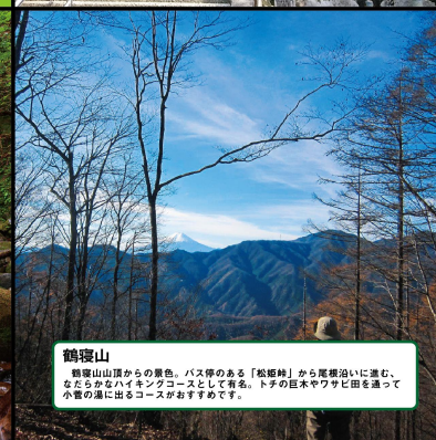
鶴寝山 鶴寝山山頂からの景色。バス停のある「松姫峠」から尾根沿いに進む。 ならかなハイキングコースとして有名。トチの巨木やワサビ田を眺めて 小菅の湯に出るコースがおすすめです。