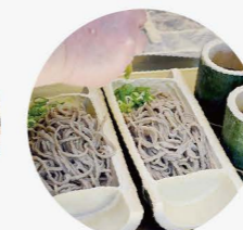
名物！手作り源流そば