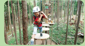
キャノピーコース

小学4年生以上、または身長140cm以上、体重130kgまでの方が体験できるスリル満点のコース。