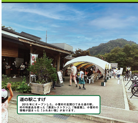
道の駅こすげ 2015年にオープンした、小菅村の玄関口である道の駅。 村の特産品を使った「ふれあい館」、「物産館」、小菅村の 情報が詰まった「ふれあい館」があります。